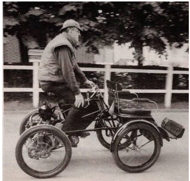
Archivbild: De Dion Quadricycle

Mail: info@rottaler-veteranen-freunde.de Homepage: www.rottaler-veteranen-freunde.de Telefon: +49 171 1 12 42 80